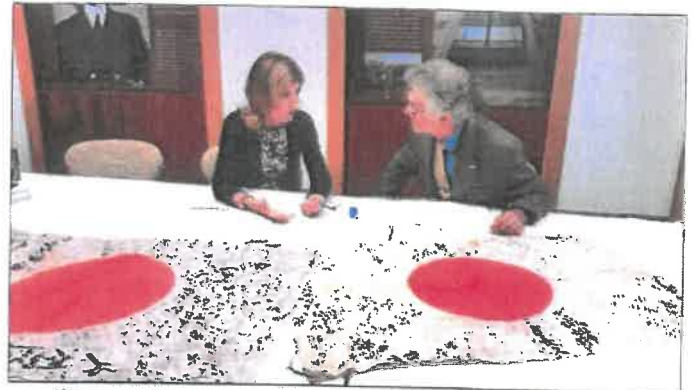
当団体の活動を熱心に聞かれる キャロライン・ケネディ大使