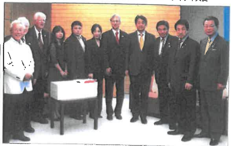
首相官邸において安倍総理表敬訪問