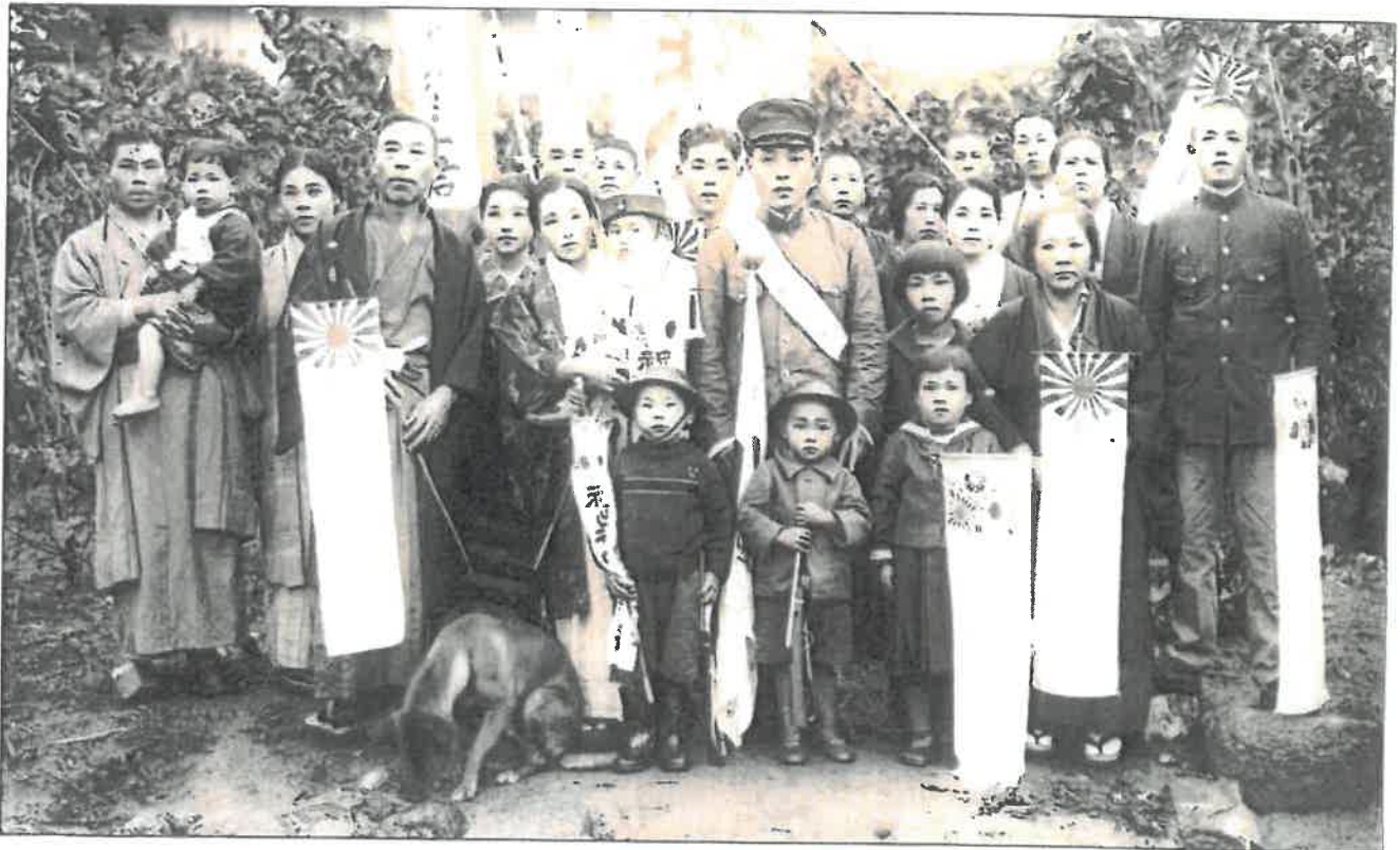
出征する日本兵

OBON SOCIETY はアメリカを中心として欧米諸国に、寄せ書き日の丸の意味を正しく伝えることで、旗返還を通じた平和啓発を続けている。